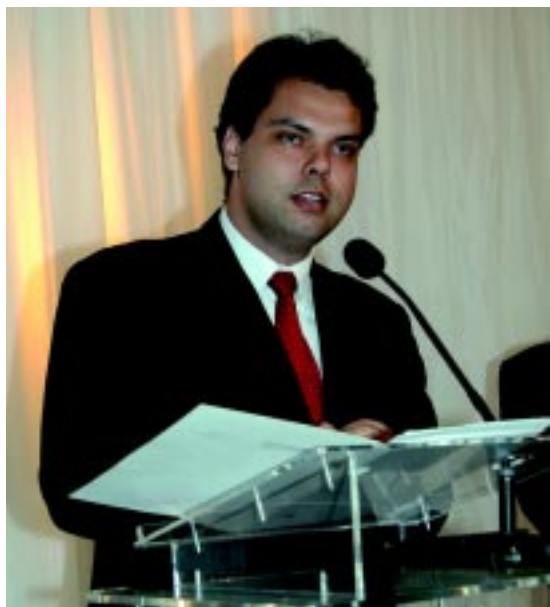
O patrono do evento, Deputado Estadual Bruno Covas