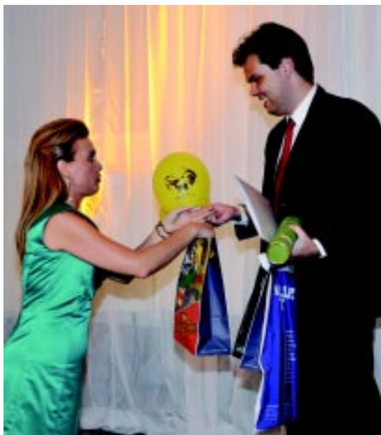
Bruno Covas recebe presentes oferecidos pelas empresas homenageadas